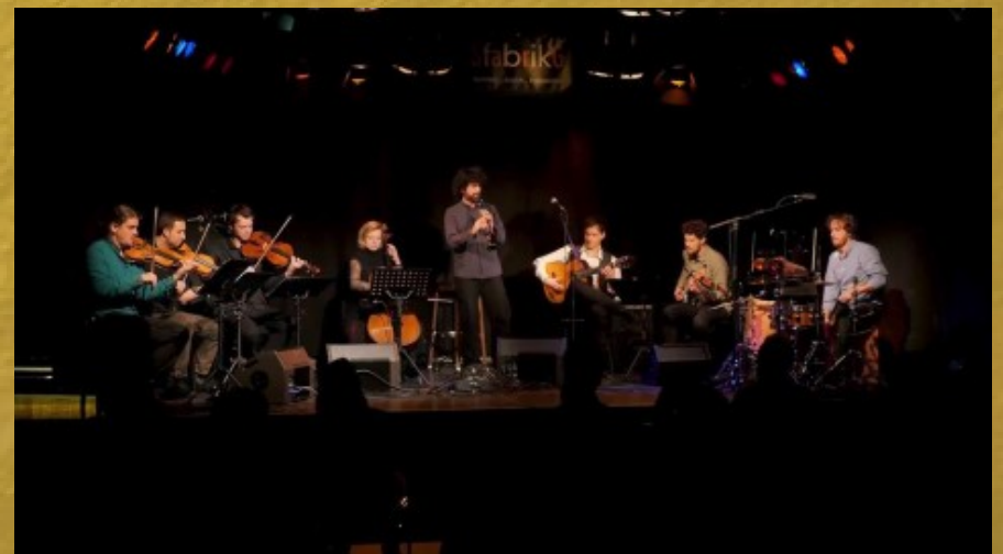
Entremig (com quarteto de corda)