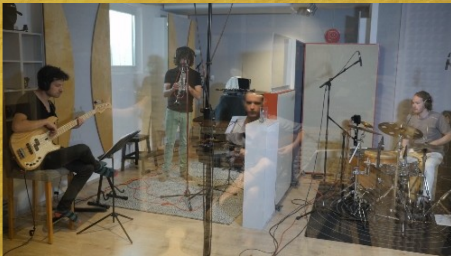
Esperant-te a Sofia